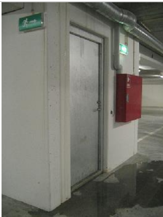
Synlig vandindtrængen på P-dæk 3, ved flugtvejstrappe 2