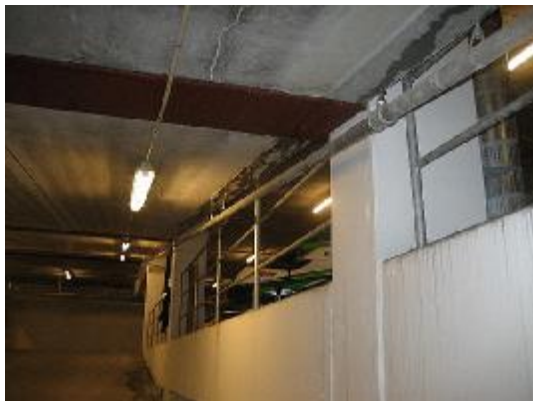
Synlig vandindtrængning på underside rampe