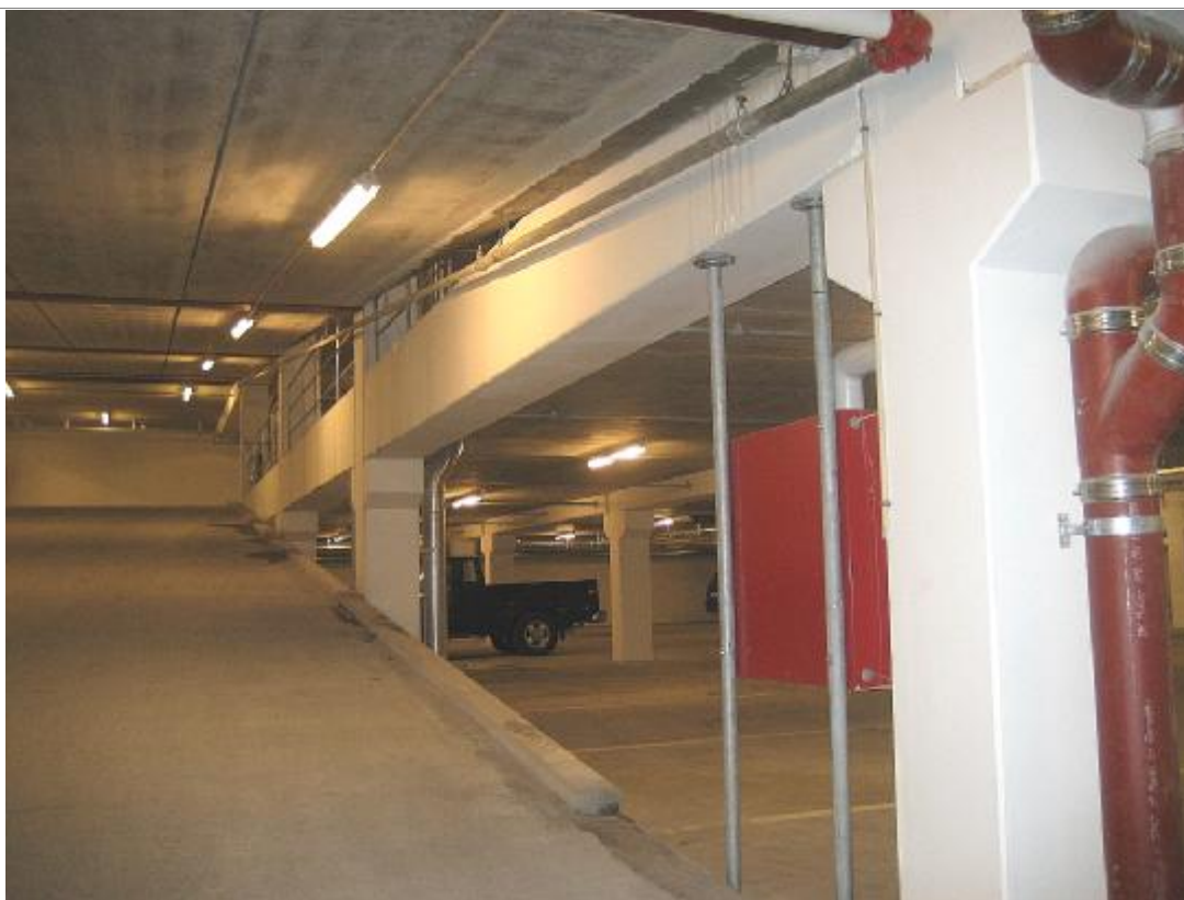
Synlig vandindtrængning på underside rampe ( fra P-dæk 1) og på rampe mellem P-dæk 2 og P-dæk 3