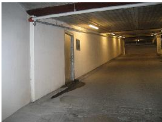
Synlig spor af vand langs rampen mod væg