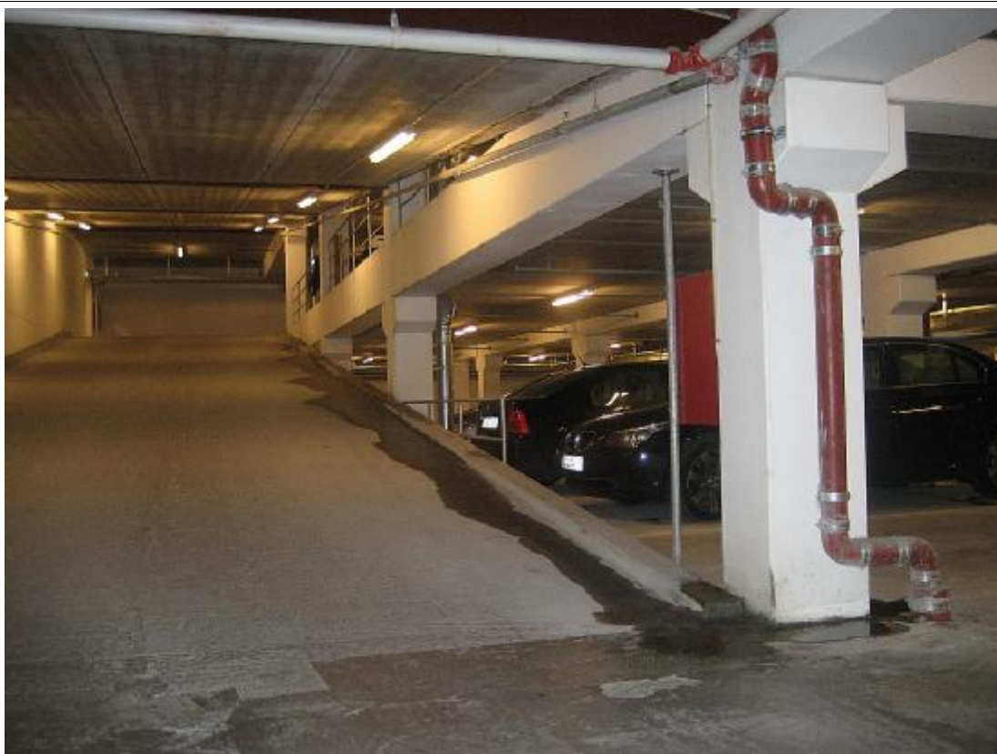
Synlig spor af vand langs rampens frie kant