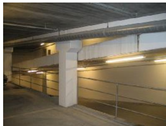
Synligt vand på rampekant udfor P-dæk 2