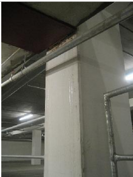
Synlig vandindtrængen ved rampe mellem P-dæk 3 og P-dæk 2