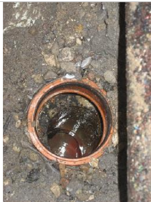
Studs for afløbsføring gennem betondæk til underliggende afløbsrør i P-kælder. Hulboring i betondæk er blottet og der kan observeres si- vende vand over/under vandtætningsmembra- nen nedover kanten af det hulborede betondæk.