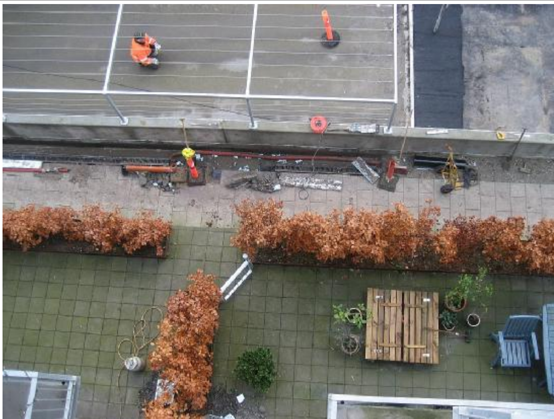
Opgravning mellem rampekant og vandrende opstartet – foto af 10.12.2008

Utætheder i loft ved langsgående rampekant