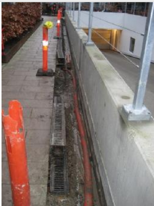
Opgravning mellem rampekant og vandrende Studs for afløb fra vandrende er placeret ved rød markeringspæl med gul plastpose

Utætheder i loft ved langsgående rampekant