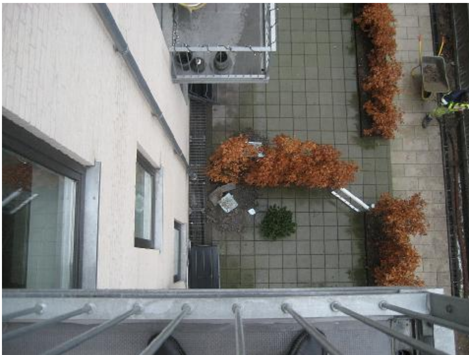
Opgravning om tagedløb opstartet – 9.12