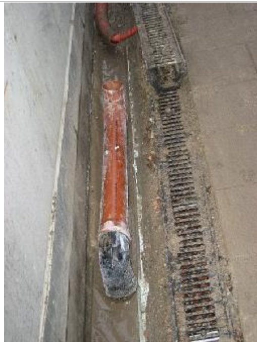
Afløbsrør fra vandrende til studs (tildannet)