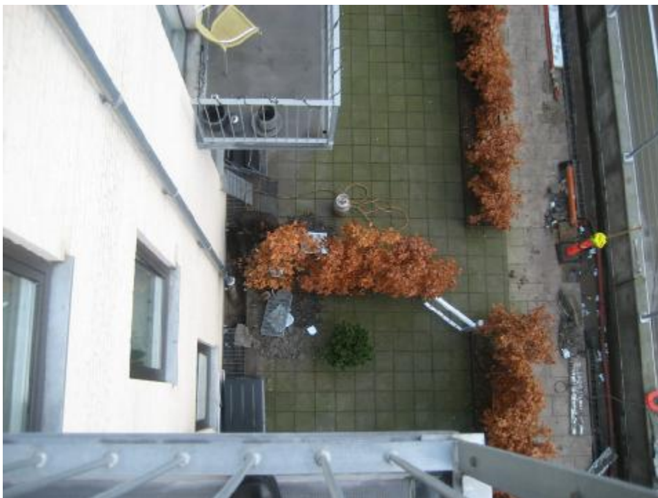
Opgravning om tagedløb ved afslutning – 10.12