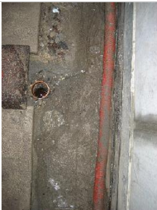
Studs for afløbsføring gennem betondæk til underliggende afløbsrør i P-kælder

Utætheder i loft ved langsgående rampekant